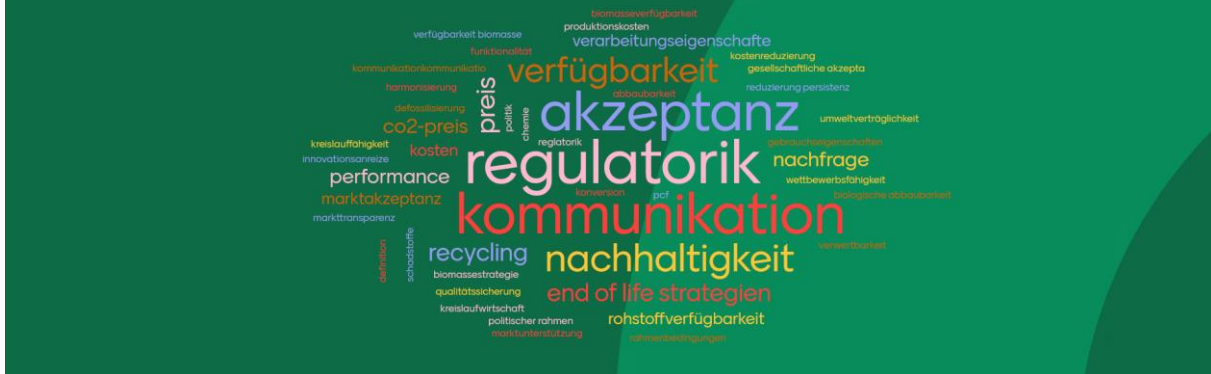
Abbildung: Wortwolke zu zentralen Punkten zu Markt- und Produktentwicklung biobasierter Kunststoffe

Dabei steht die Wortgröße für die Häufigkeit der Nennungen. Je größer ein Begriff dargestellt ist, desto öfter wurde er genannt und umso höher ist seine Bedeutung für die Markt- und Produktentwicklung biobasierter Kunststoffe aus Teilnehmersicht. Es stehen besonders die Begriffe Regulatorik, Kommunikation, Akzeptanz, Nachhaltigkeit und Verfügbarkeit ins Auge. Sie und auch andere Begriffe aus dem Mentimeter fanden sich in den anschließenden parallellaufenden Workshops einheiten zu